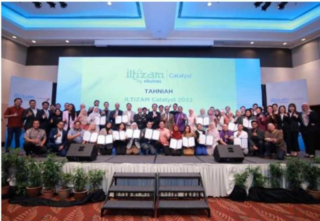
EkuiNAS merayakan kejayaan program ILTIZAM Catalyst 2022 bersama-sama PKS Bumiputera.

KUALA LUMPUR 27 Julai - EkuiNAS Nasional Bhd memperuntukkan RM20 juta kepada ILTIZAM, cabang tanggungjawab sosial korporatnya, untuk melaksanakan program sejajar dengan misi perniagaan teras dengan tiga tonggak utama iaitu pendidikan, keusahawanan dan masyarakat.